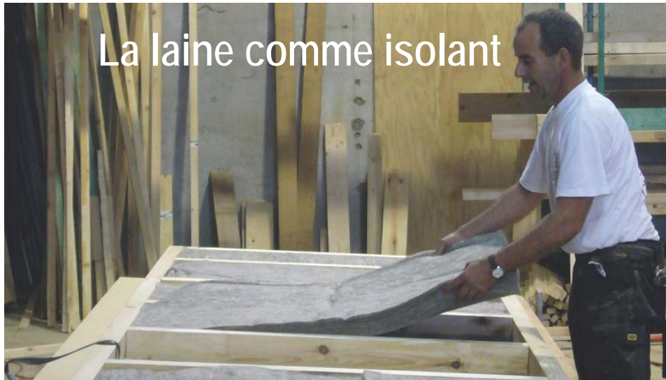
La laine comme isolant