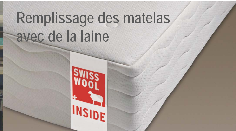
Remplissage des matelas avec de la laine