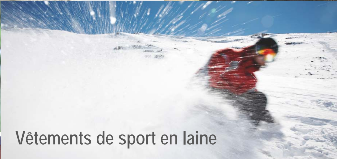
Vêtements de sport en laine