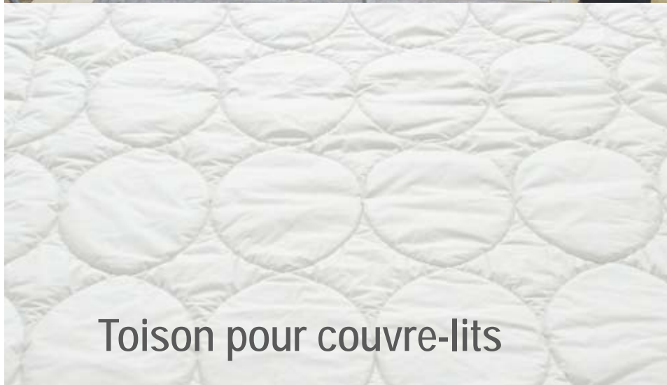
Toison pour couvre-lits