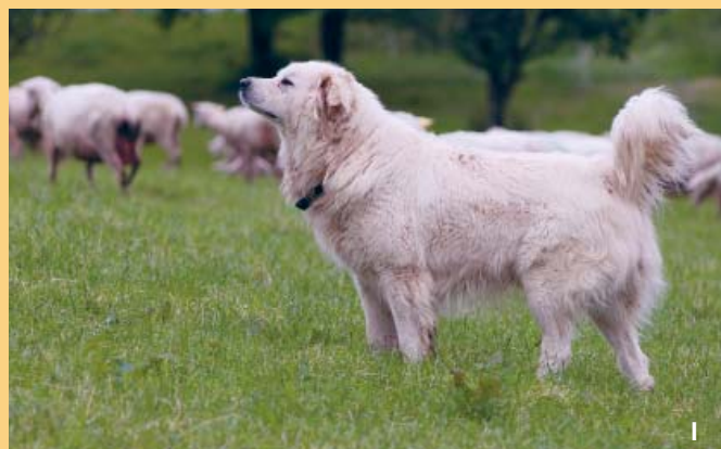
Im Rahmen des nationalen Herdenschutzprogramms werden v.a. Hunde der Rassen Maremmano Abruzzese (Foto oben) und Montagne des Pyrénées (Foto unten) eingesetzt.