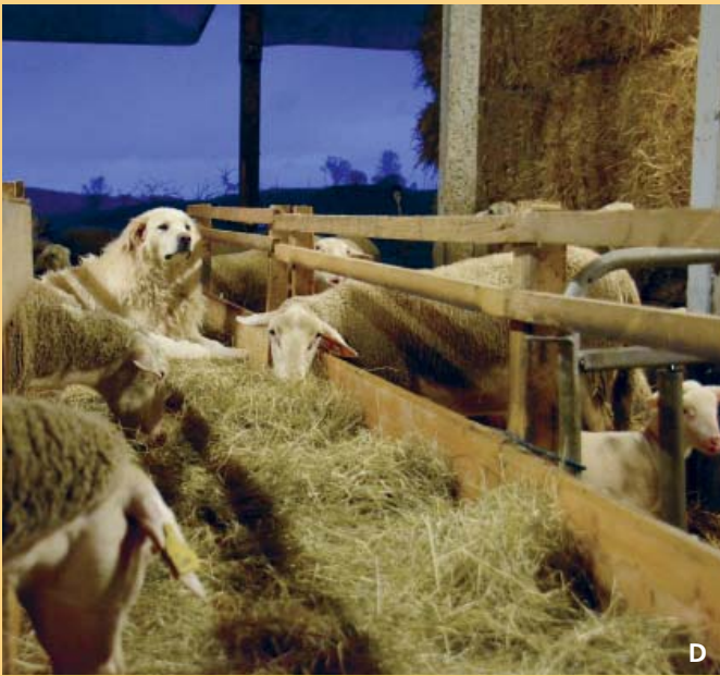
Auch ausserhalb der Weidesaison müssen die Herdenschutzhunde fachgerecht in ständigem ungehindertem Kontakt mit den Nutztieren gehalten werden können.

Zu den Herausforderungen gehören u.a. Konfliktpotenzial mit Nachbarn (z.B. wegen Gebell), zwischen Hunden und Wanderern oder Bikern sowie auch zwischen Hunden und Nutztieren. Insbesondere in den ersten Monaten nach erstmaliger Anschaffung von Herdenschutzhunden, braucht der Halter viel Zeit, Engagement und Lernbereitschaft, um eine auf Vertrauen basierende Beziehung mit seinen Hunden sowie eine gute Integration der Hunde in die zu beschützende Nutztierherde zu erreichen.