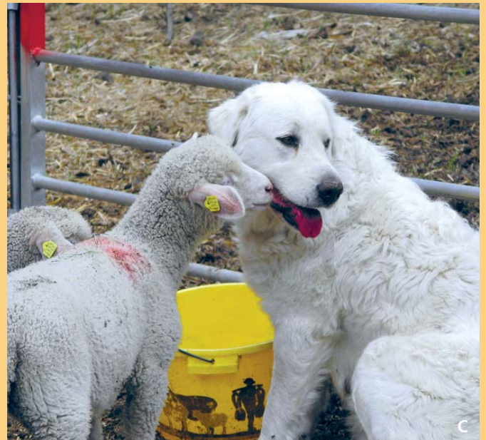
Gut schützende und gesellschaftstaugliche Hunde müssen mit Artgenossen, Nutztieren wie auch mit Menschen umfassend sozialisiert sein.