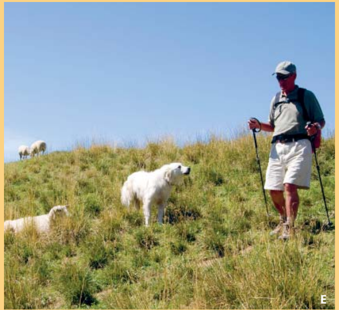
Viele Wanderer wissen nicht, wie sie sich bei Begegnungen mit Herdenschutzhunden zu verhalten haben.