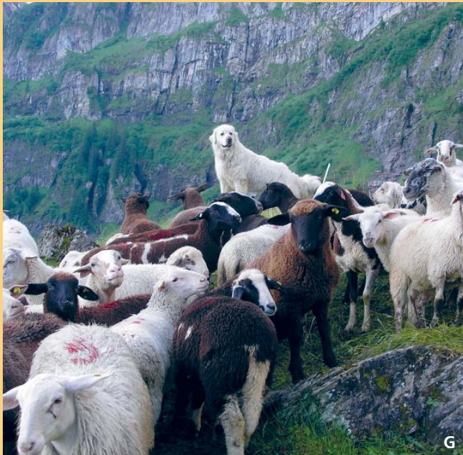
Ein Herdenschutzhund gilt mit rund zwei Jahren als erwachsen, seine maximale Effizienz erreicht er aber erst mit einer gewissen Erfahrung und im eingespielten Hunderudel.

hunden deckt – der Arbeitsaufwand des Hundehalters wird nicht entschädigt. Alpverantwortliche können für den Sömerungseinsatz von offiziellen Herdenschutzhunden ebenfalls Bundesbeiträge beantragen.