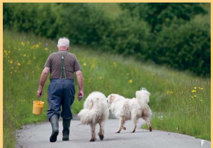
Die meisten Neuhalter schliessen ihre Herdenschutzhunde rasch ins Herz.

Siehe auch «Checkliste und Antrag zur Beratung betreffs Einsatz offizieller Herdenschutzhunde».