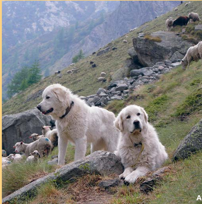
Herdenschutzhunde schützen seit Jahrtausenden Nutztiere effizient vor Raubtieren.

Dieses Merkblatt richtet sich an Personen, die die Anschaffung von Hunden zu Herdenschutzzwecken in Erwägung ziehen oder bereits Hunde zum Schutz ihrer Schafherden besitzen.