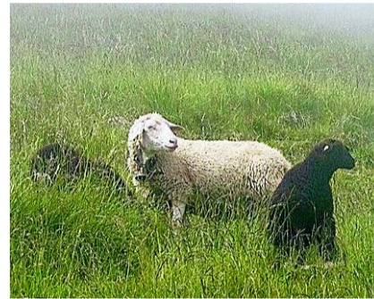
Wachsamen Schafe im Nebel.