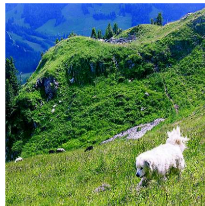
Schutzhund und Koppel (hinten).

Internet www.wwf.ch > Hirten-Hilfen und www.herdenschutzschweiz.ch