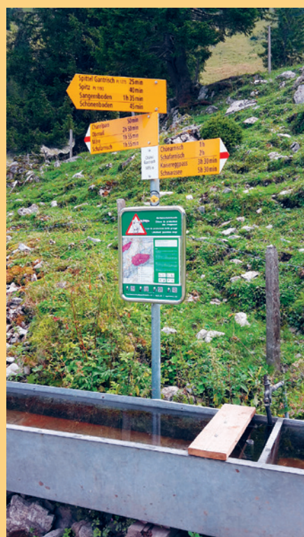
Per installare i pannelli su pali dei sentieri escursionistici ufficiali è indispensabile prendere accordi con il responsabile addetto ai sentieri escursionistici.

I pannelli di segnalazione esistono in una versione standard in metallo (sinistra, 36 × 59 cm) e in una versione leggera più piccola in plastica (destra, 15 × 30 cm). I pannelli in plastica, facili da trasportare, possono essere utilizzati nei punti in cui occorrono solo per breve tempo e a titolo informativo nei luoghi di minore importanza.