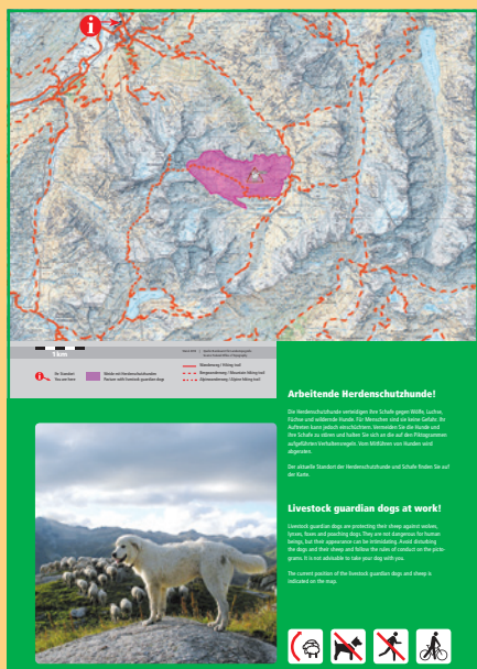
Esempio di pannello in due elementi per il pannello base più grande (ubicazione Andermatt UR).