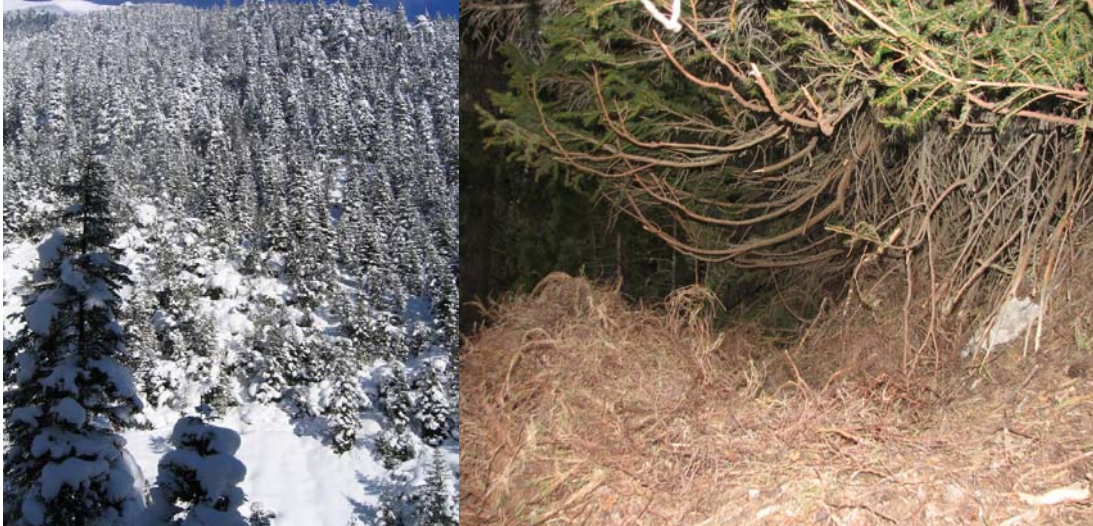
Südhang als Winterlager