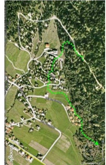
Savognin, April 2008

JJ3 erkundet neue Regionen in Richtung Oberhalbstein und beginnt auch wieder, Siedlungen und Einzelhäuser zu besuchen und nach Fressbarem zu durchsuchen. Am 23. März reisst er einen wahrscheinlich verletzten oder kranken Hirsch zwischen Brienz und Surava (Fotos Digitale Fotofalle). Diesen nutzt er innert Wochenfrist beinahe vollständig. Gleichzeitig besuchte er aber jeweils nachts die umliegenden Dörfer und untersucht auch zwischen den Häusern Kompostkübel, Abfalleimer, etc. Nach Ostern weitet er seine Touren massiv aus. Diese führten ihn nach Alvaschein sowie ins Oberhalbstein (bis Saletscha im Val Schmorras und Rona). Am 9. April kehrte er wieder an den Südhang zwischen Lantsch/Lenz und Alvaneu zurück.