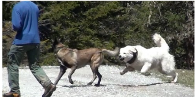
Hund und Figurantenhund begegnen sich mit (oben) und ohne Nutztiere (unten). Mit Nutztieren darf der Hund den Figurantenhund abwehren.