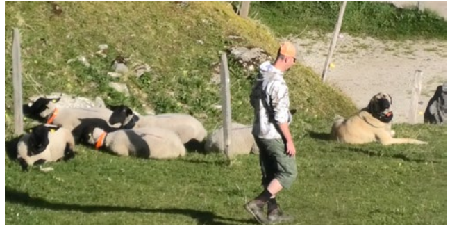
Begegnung Figurant mit zu prüfendem Hund und Nutztieren. Das Verhalten des Hundes wird dokumentiert.

Neben dem Reglement Eignungsprüfung Herdenschutzhunde trägt ein Sicherheitsgutachten mit Notfallplan pro Prüfungsgelände zu einem sicheren Prüfungsablauf bei. Die Prüfungskommission verfügt über ein Notfallkonzept, um in ausserordentlichen Situationen ein effizientes und einheitliches Vorgehen sicherzustellen.