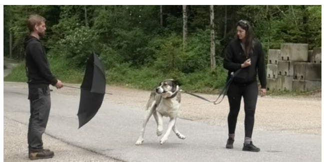
Mit einem Schirm wird die Stresstoleranz des Hundes überprüft.