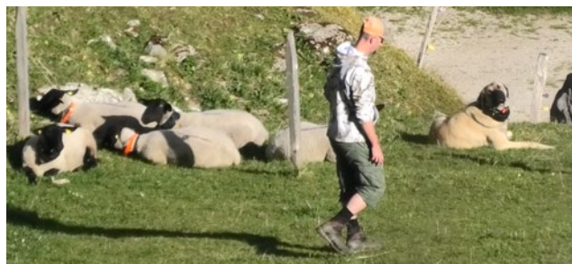
Incontro tra il figurante e il cane da esaminare in presenza degli animali da reddito. Il comportamento del cane viene documentato.

Oltre al regolamento dell'esame di idoneità per i cani da protezione delle greggi, una perizia di sicurezza con piano di emergenza per ogni area d'esame contribuisce allo svolgimento sicuro della prova. La commissione d'esame dispone di un piano di emergenza per garantire un approccio efficiente e uniforme in situazioni straordinarie.