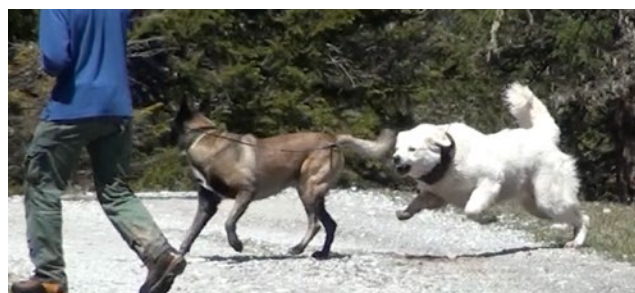
Il cane e il cane figurante si incontrano con (in alto) e senza (in basso) animali da reddito. In presenza di animali da reddito, il cane può mostrare un comportamento di difesa nei confronti del cane figurante.