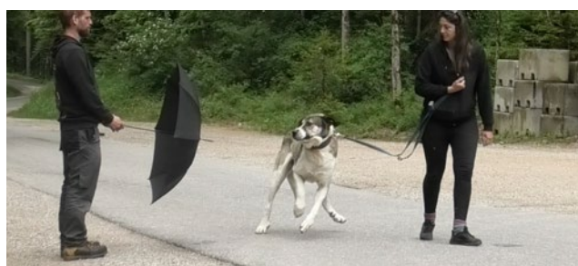
La tolleranza allo stress del cane viene verificata con un ombrello.