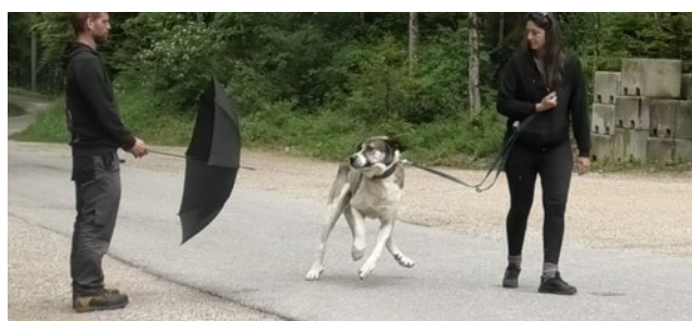
La tolérance au stress du chien est testée au moyen d'un parapluie.