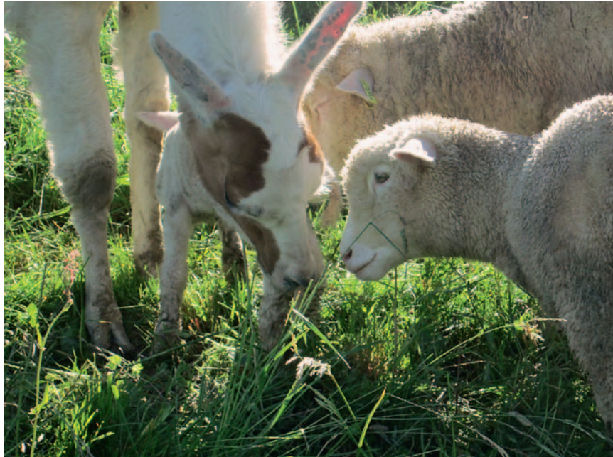
Die Bindung zwischen Schaf und Lama entwickelt sich am Besten in kleineren Weidekoppeln. Le lien entre les moutons et le lama se développe au mieux dans des petits parcs.

Das kleinstrukturierte Voralpengebiet mit mehrheitlich kleinen Talbetrieben ist geprägt von relativ intensiver landwirtschaftlicher und touristischer Nutzung. Dadurch können verschiedene Nutzungskonflikte entstehen, die unter anderem auch dem Einsatz von Herdenschutzhunden Grenzen setzen. Das Lama als Herdenschutztier löst hingegen kaum Konflikte mit Wanderern, Jägern oder Nachbarn aus und ist ausserdem ein robustes und kostengünstiges Nutztier. Im Frühling 2012 konnte mit einer breit abgestützten Trägerschaft das Projekt gestartet werden. So wurden in den Kantonen Luzern und Waadt vier Schafbetriebe ausgewählt, wo Lamas im Frühling in die Herden integriert wurden (Kasten «Pilotprojekt 2012-2013», Seite 12).