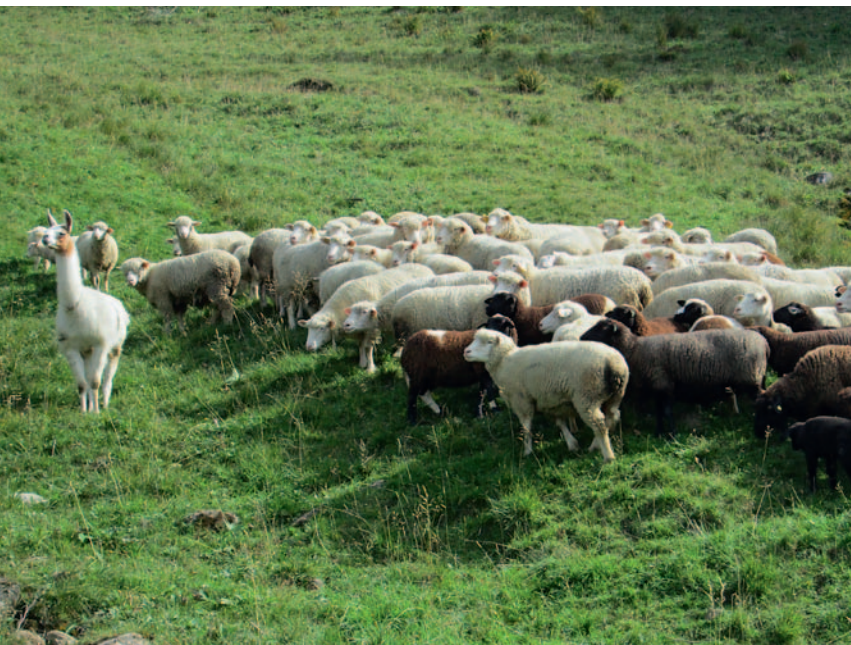
Typische Haltung des Lamas beim Erkennen einer Störung. Posture typique d'évaluation d'un problème.

Dans les exploitations d'estivage sélectionnées, des observations d'un jour ont été menées au printemps et en automne pour documenter le comportement du lama ainsi que son interaction avec les moutons. La dynamique entre les moutons et le lama est influencée par des facteurs très divers. Ainsi, les races de moutons, la taille du troupeau, la topographie et le type de végétation ainsi que l'homogénéité et la conduite du troupeau constituent un ensemble complexe de variables. Dans le relevé des données, on a tenté de quantifier la vigilance au moyen du rapport entre les périodes d'alimentation et d'observation. On a également inscrit les déplacements des lamas par rapport aux moutons ainsi que l'état d'alerte et la durée de séjour aux différents emplacements. Afin