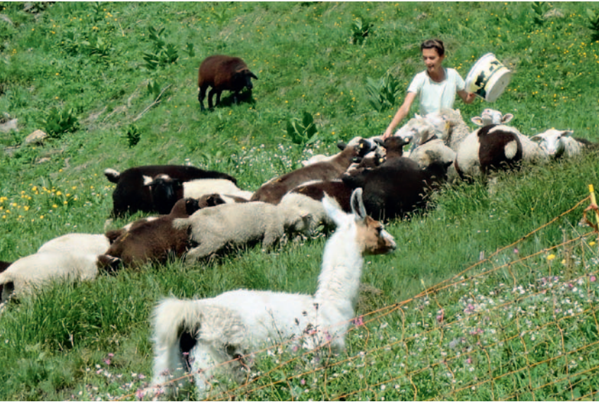
Aufmerksamkeit und Neugier zeichnen die Lamas aus. Le lama est un animal attentif et curieux.

Neben dieser quantitativen Erfassung der Schutzqualität wurden die Bewirtschafter, die Lamazüchter und ein langjähriger Lamahalter als Experten befragt. Dies ermöglichte, die nötigen Zusatzinformationen zu erhalten, um das Verhalten der Tiere mit den spezifischen betrieblichen Voraussetzungen richtig zu interpretieren.