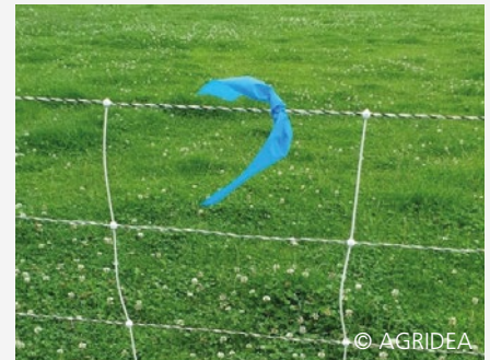
Weidenetz mit Flutterband blau

Einsatzzweck: Gilt für Luchs und Wolf, nicht für Braunbär