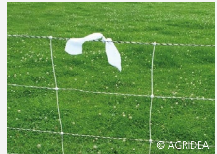
Weidenetz mit Flutterband weiss

Merkblatt: «Wolfschutzzäune auf Kleinviehweiden», AGRIDEA