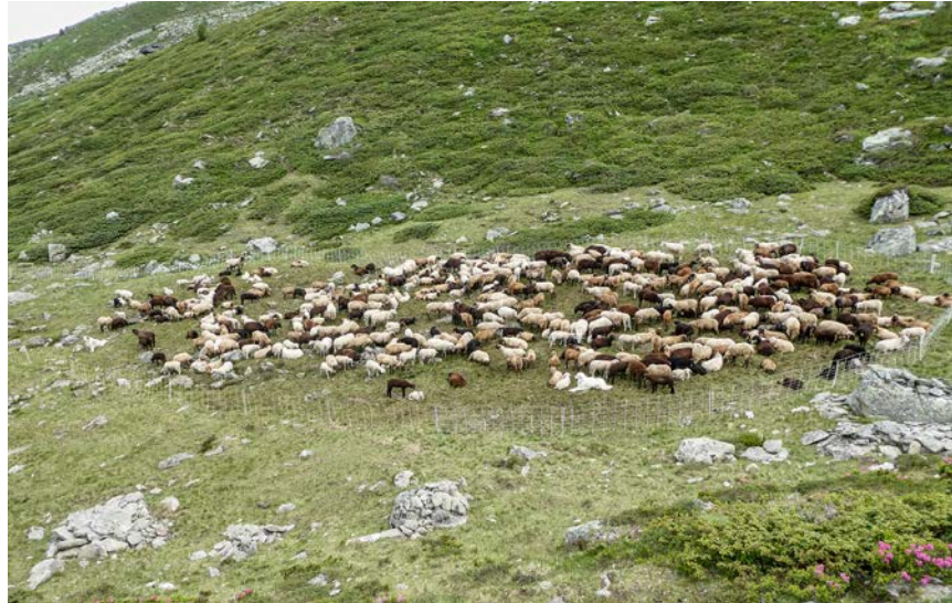
Mit mobilen Nachtpferchen können Weideflächen gezielt verbessert werden. Les parcs de nuit mobiles permettent d'améliorer les surfaces pâturées de manière ciblée.

Schafe verbringen auf der Weide – insbesondere während der Sömmerung – zwischen acht und elf Stunden pro Tag mit Nahrungsaufnahme. Sie verteilt sich auf vier bis sieben Fressperioden, die immer wieder durch Wiederkauphasen unterbrochen wird. Der Einsatz von Pferchen auf der Alp ist optimal auf den Fresszyklus der Wiederkäuer abzustimmen. Werden die Tiere in mobilen oder fixen Pferchen mittags und nachts eingezäunt, ist während dieser Zeit keine Futteraufnahme möglich. Die Nutztiere müssen während den Weidephasen ausreichend Futter aufnehmen, um die Ruhezeiten optimal zum Wiederkäuen nutzen zu können. Nur so sind das Wachstum und die Vitalität der Tiere gesichert. Durch regelmässiges Einpferchen werden die Tiere an einen gemeinsamen Fressrhythmus gewöhnt. Die Standorte der Pferche sollten so gewählt sein, dass lange Treibwege vermieden werden. Der richtige Einsatz erleichtert dem Hirtenpersonal zudem die Arbeitsorganisation.