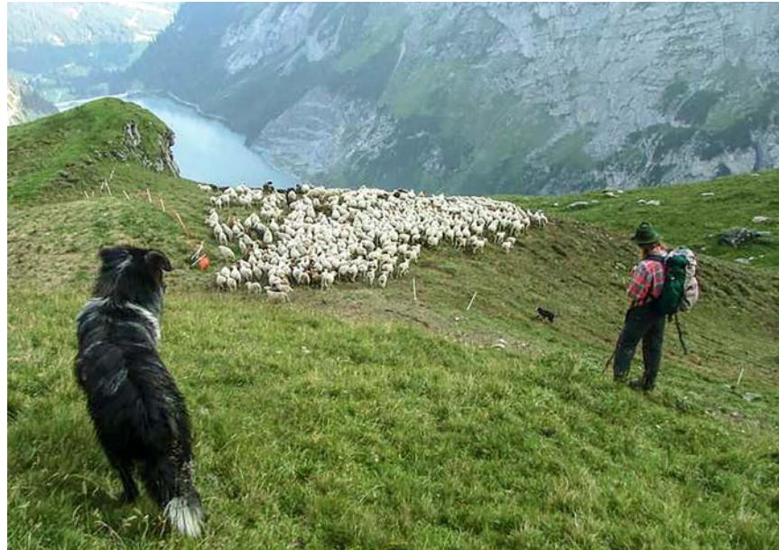
Hütehunde und Hirten stellen sicher, dass alle Schafe eingepfercht werden. Chiens de troupeau et berger s'assurent que les moutons soient bien parqués.

Une mise en parcs régulière permet d'habituer les animaux à un rythme d'ingestion commun. On choisira